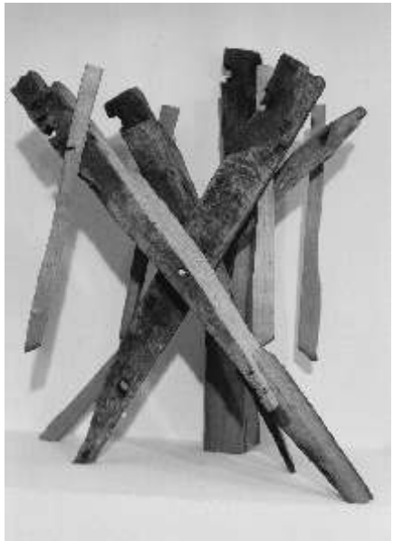
Britta Deutsch: Blinde II, Eiche, Eisen, Höhe 79 cm, 1999